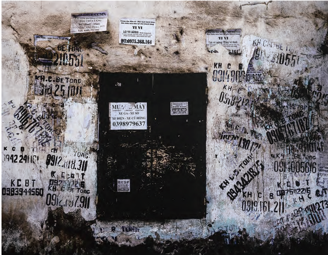
Torrent62_0798 (2023)